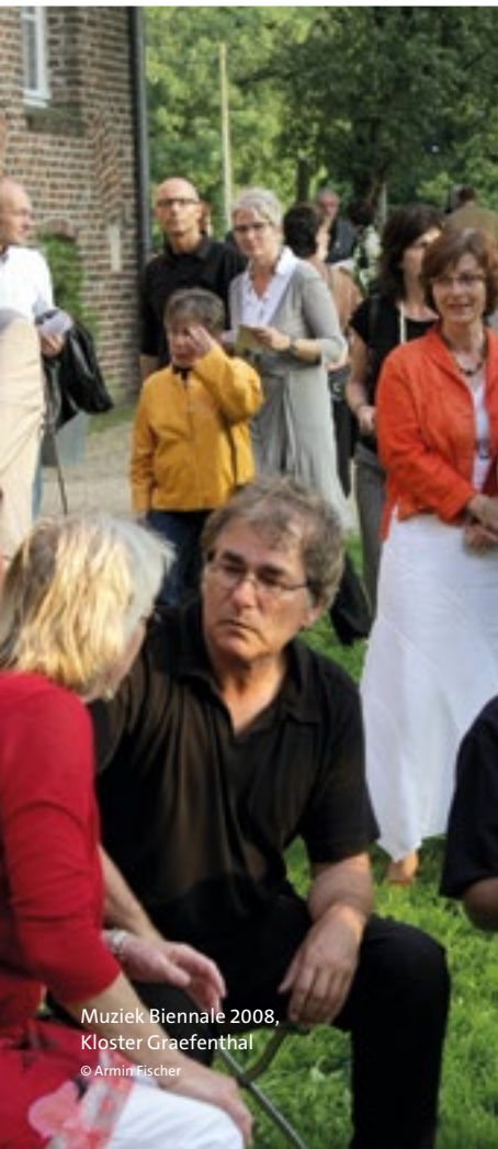
Muziek Biennale 2008, Kloster Graefenthal