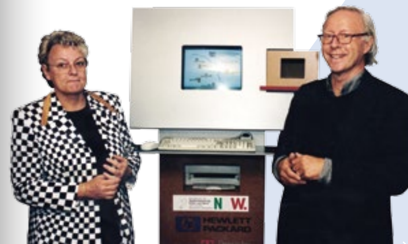
Ministerin Ilse Brusi und Vorstandsvorsitzender Klaus-Peter Kienitz auf der documenta 1997