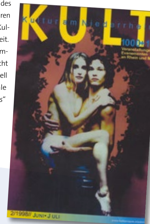
kult Ausgabe Juni / Juli 1998

Sehr rasch einigte man sich auf das Kooperationsformat NIEDERRHEINISCHER HERBST, der jährlich unter einem gemeinsamen Themendach das Beste des lokal Vorhandenen auf regionaler Bühne zusammenführen und vermarkten sollte. Eine Projektgruppe, von den Kulturdezernenten berufen, leistete die Koordinierungsarbeit. Der Verein Kulturraum Niederrhein moderierte die Kommunikation zwischen den Beteiligten. Wer heute Einsicht nimmt in das gewaltige Vereinsarchiv, bekommt schnell eine Ahnung davon, mit welchem Aufwand regionale Vernetzung in der prädigitalen Epoche des „Telefaxens“ verbunden war.