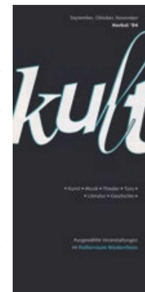
Erste Kult-Ausgabe Herbst 1994

Der Grafiker Alfred Friese schuf das einzigartige kult-Gesicht, das sich trotz Formatwechsel, typografischer und entsprechender Layout- Modifikationen immer treu geblieben ist. Mit grenzenloser Entdeckungsfreude kreierte er die unverwech-