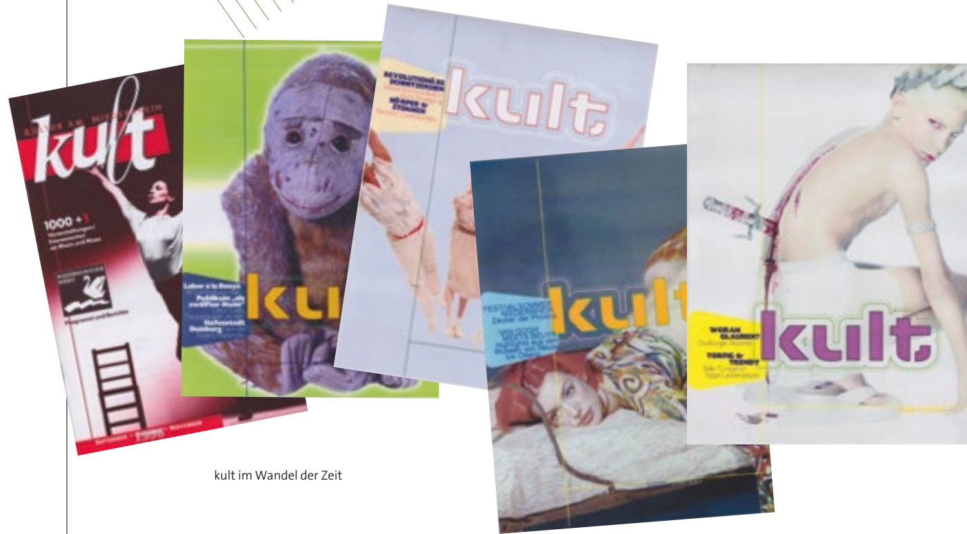
kult im Wandel der Zeit

selbaren Titelmotive und entwickelte auf jeder Seite mit viel Liebe zum Detail die Einzigartigkeit, die die dort vorgestellten Kulturthemen in Bild und Text für sich in Anspruch nehmen. kult gelang es, sich mit seiner Vielzahl kritischer und erfrischend freier Beiträge schnell von der Masse der Ankündigungs- und Advertorial-Magazine abzusetzen, die verborgenen und unverwechselbaren Schätze am Niederrhein auch jenseits der Redaktionsgebiete regionaler Tageszeitungen bekannter zu machen und die zahlreichen lokalen Einzelveranstaltungen zu einem regionalen Veranstaltungskonzert zu bündeln.