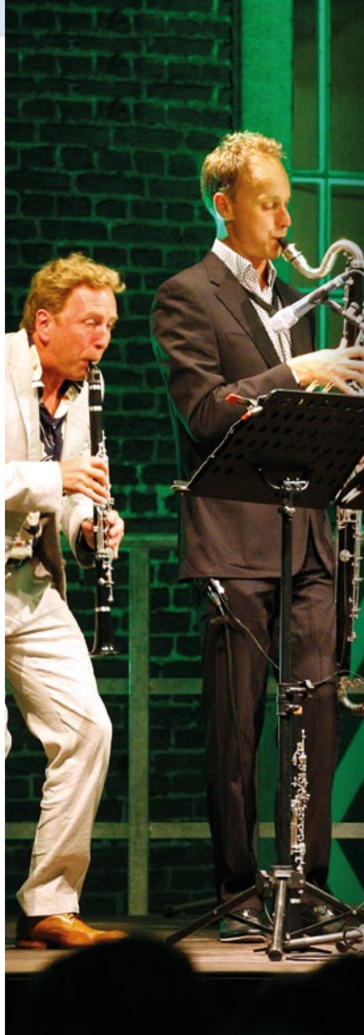
Ensemble Calefax, Muziek Biennale 2012