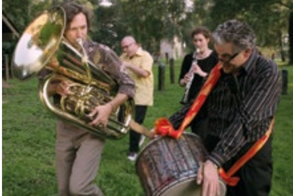
Weißer Nepix, 2009, Installation von Keisuke Matsuura im Rahmen von Different Places – Different Stories 2009