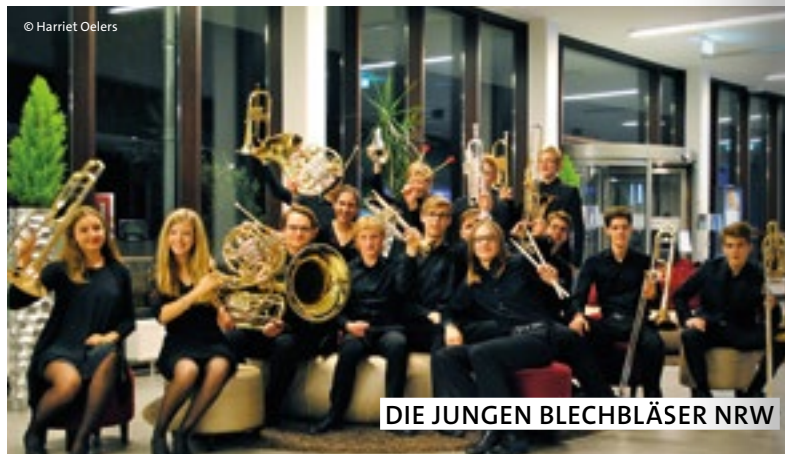
DIE JUNGEN BLECHBLÄSER NRW