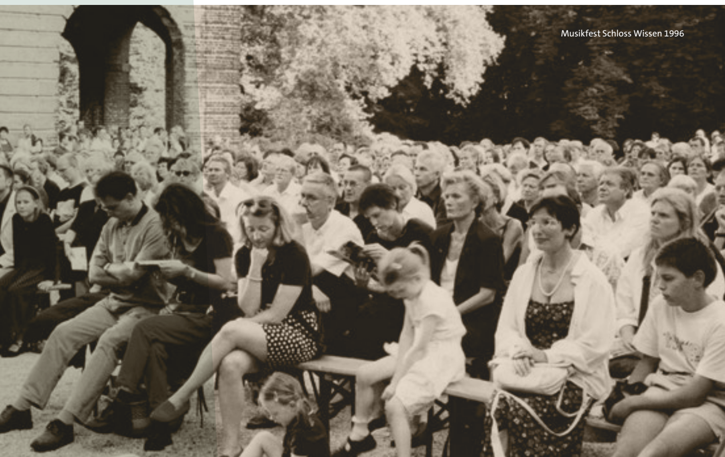
Musikfest Schloss Wissen 1996