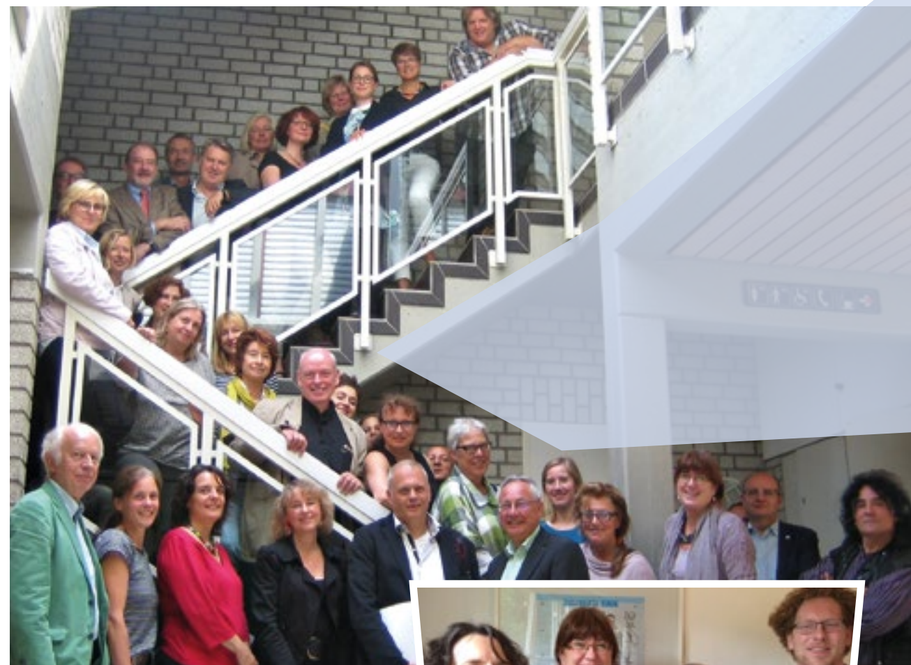
Sommersitzung des Arbeitskreises Regionalkultur am 28.06.2016 im Museum Goch