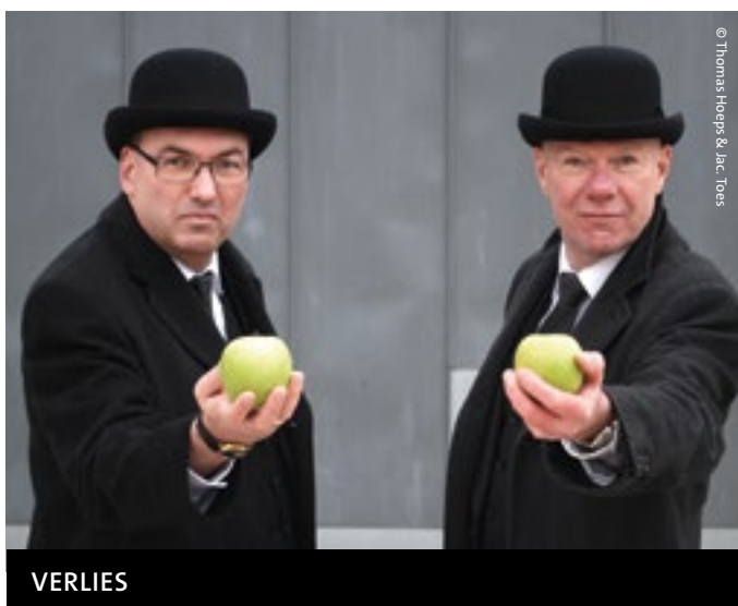
© Thomas Hoeps &amp; Jac. Toes