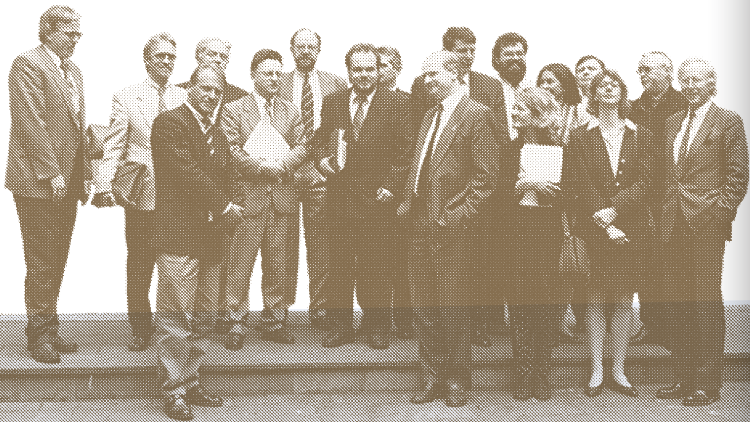
Mai 1994, Kempen: Erste Kulturkonferenz der Städte