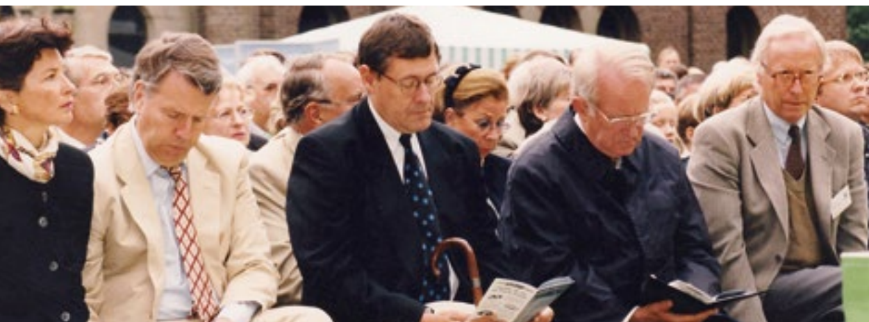
Musikfest Schloss Wissen mit Schirmherrn Ministerpräsident Johannes Rau

Die Regionale Kulturpolitik des Landes Nordrhein-Westfalen, die Ministerpräsident Rau 1995 proklamierte und 1997 mit der Einrichtung von Koordinierungsstellen in neun Kulturregionen NRW ausgestattet wurde, konnte auf die schon vorhandenen Gremien-, Kommunikations- und Projektstrukturen am Niederrhein aufsetzen. Dem Kulturraum Niederrhein e.V. wurde die Aufgabe der regionalen Leitbildentwicklung, der Förderberatung sowie der Unterstützung von Kooperationen durch Vernetzung, Koordinierung und Qualifizierung übertragen. Außerdem sollten Schnittstellen geschaffen werden zwischen Kultur, Stadtentwicklung, Tourismus und Wirtschaft. Von November 1996 bis '97 wurden in verschiedenen Expertenforen Profile und Leitvorstellungen herausgearbeitet. Die schon bekannten wurden ergänzt um die Themen „Kultur durch Arbeit“, „Niederrhein-Akademie – Denkwerk“ sowie die Querschnittsaufgabe „Kinder- und Jugendkultur“. Kooperationsprojekte aus diesen Handlungsfeldern konnten fortan mit Fördermitteln der Regionalen Kulturpolitik ausgestattet werden, wobei dem Arbeitskreis Regionalkultur die Rolle der kulturfachlichen Beurteilung und Förderempfehlung übertragen wurde.